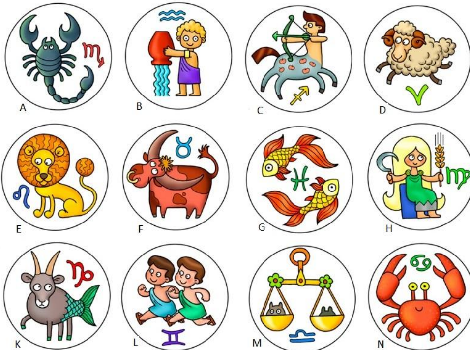
Съзвездия и рисунки – към задача 4.