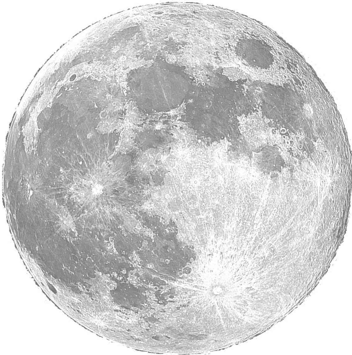
Луната – към задача 3.

Краен срок за предаване на решенията – 15 януари 2019 г. (вторник).